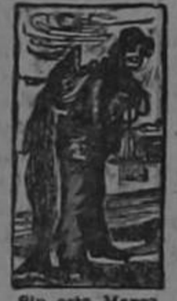
Sin esta Marca Ninguna es Legítima.